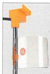
TRAPANO COMPLETO DI PROTEZIONE